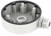
DS-1280ZJ-DM46 Junction Box