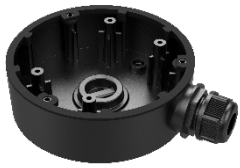
DS-1280ZJ-DM46(Black) Junction Box